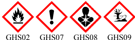
GHS02 GHS07 GHS08 GHS09